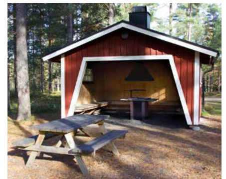
På området finns flera olika grillstationer, en del med vindskydd. Ett mycket uppskattat inslag av besökare.

Tack vare engagemanget från föreningen pågår ett aktivt friluftsliv i området – året runt. Andra föreningar, som exempelvis orienterings- och