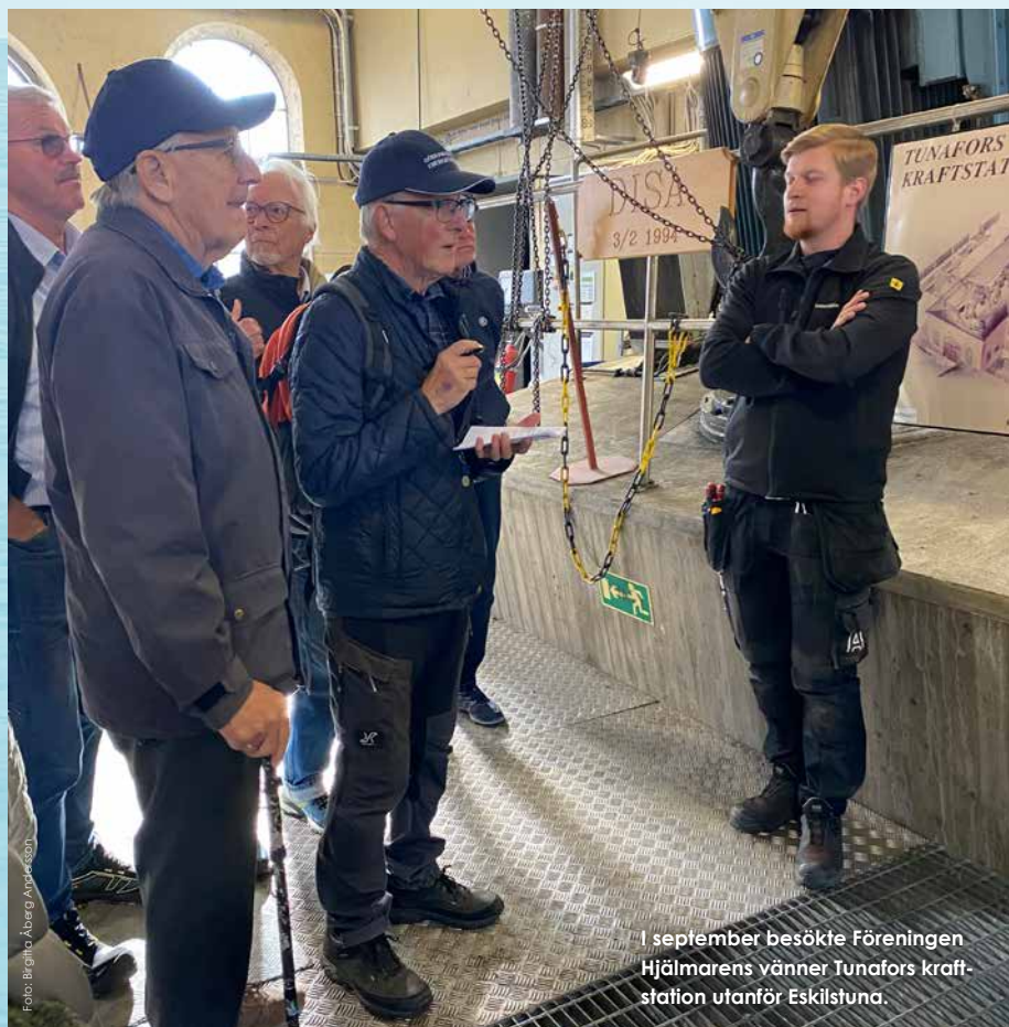
I september besökte Föreningen Hjälmarens vänner Tunafors kraftstation utanför Eskilstuna.